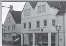
Hindenburgstraße 39 89129 Langenau Tel: 07345/21792