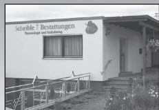
Blumenstraße 16 89183 Holzkirch Tel: 07340/9697-0